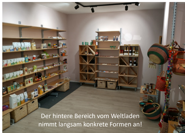
Der hintere Bereich vom Weltladen nimmt langsam konkrete Formen an!

Aspekten der Barrierefreiheit und zu inklusiver Öffentlichkeitsarbeit. Es lädt auch dazu ein, bisherige Erfahrungen mit inklusiven Ansätzen in der eigenen Arbeit zu reflektieren und in den Austausch mit anderen zu kommen. Infos und kostenlose Anmeldung hier .